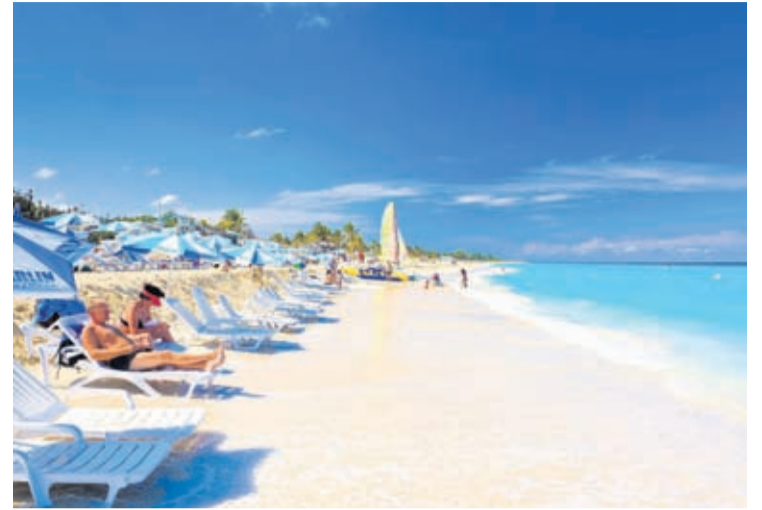
ismo internacional dia 1 di juli proximo.

de varios dia a cuminsa train e personal pa por cumpli cu e protocolnan nobo cu lo ta na vigor, incluyendo accion di vigilancia epidemiologico pa garantiza seguridad di usuario y personal. Matanzas a drenta den e asina yama promer fase di recuperacion 'post-coronavirus' despues di muestra cifra di control satisfactorio di e epidemia. Hunto cu Habana y provincia a keda exclui di apertura di e promer fase siman pasa 18 di juni, pasobra ainda tabata reporta caso nobo di coronavirus. Cuba tin programa pa habri pa tur-